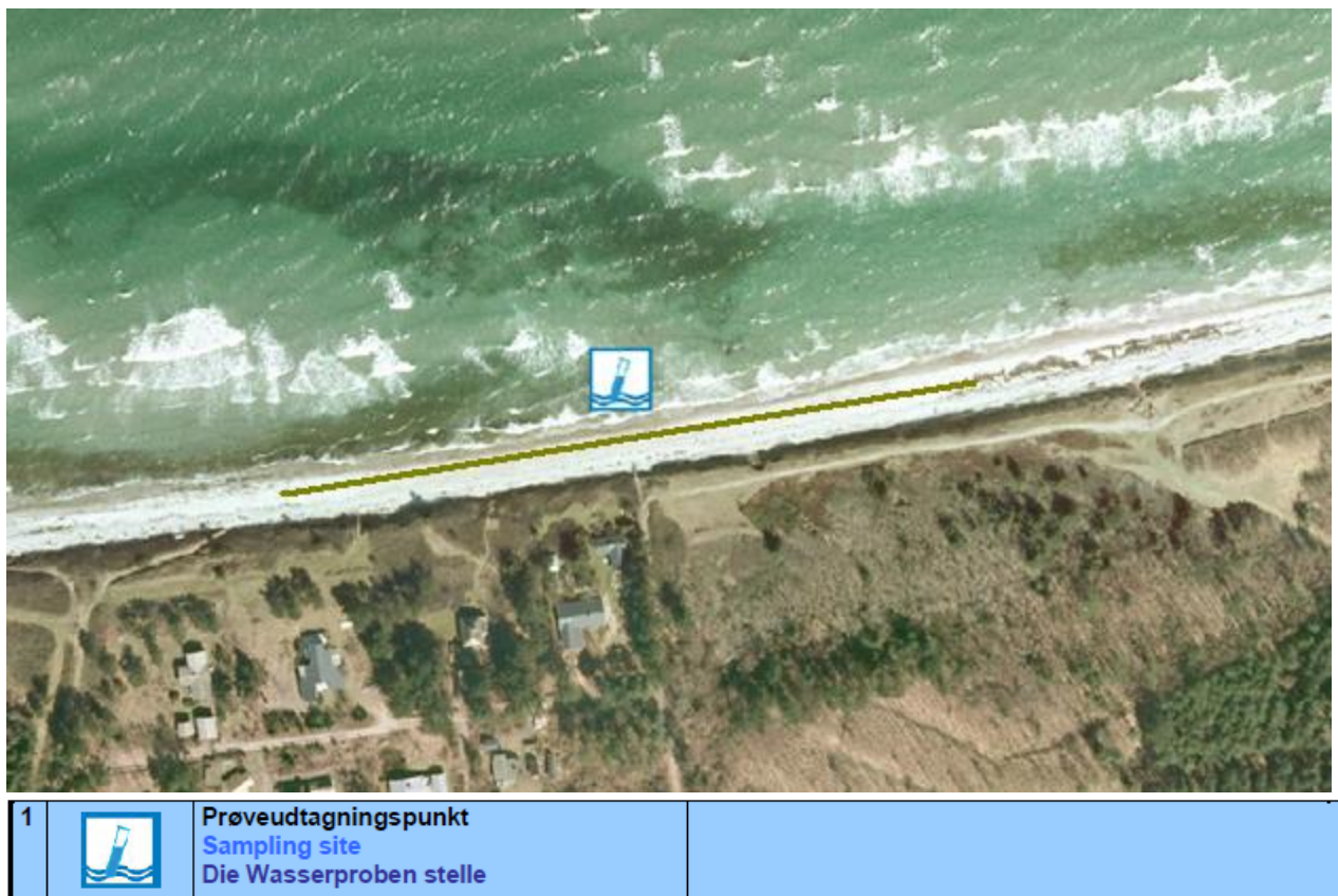
Fig. 1. Oversigtskort over Sonnerup skov strand, med information om diverse faciliteter.

Badestedet er beliggende ud mod Kattegat, nord for Lumsås. Her findes en sandstrand med nogen sten og strandens udstrækning fremgår af kortet nedenfor (Fig. 1). Stranden er ca. 250 meter lang og består af et område af sand/sten der er ca. 13 meter bredt. Der er, ved prøvetagningsstedet, ca. 14 m ud til ½ meters dybde og 100 meter til 2 meters dybde (aflæst på søkort).