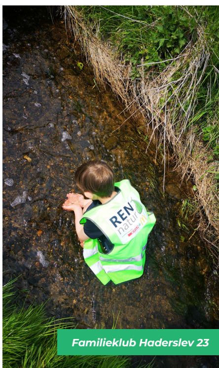
Familieklub Haderslev 23

Det er også her der skal lyde et stort TAK til Ølgod Efterskole, som donerede deres indsamlede midler indtjent ved den årlige 100 km gåtur rundt om Ringkøbing Fjord i 2022. Deres donation er anvendt netop til denne gruppe og vi er overbevist om, at det glæder alle elever og deres forældre at høre hvilken forskel, de har været med til at gøre.