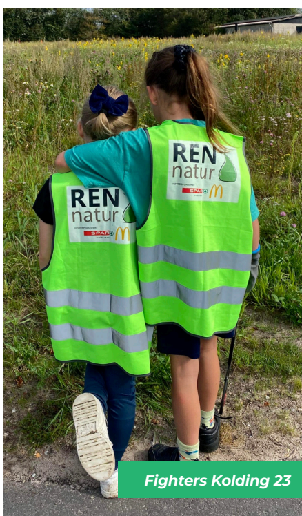
Fighters Kolding 23