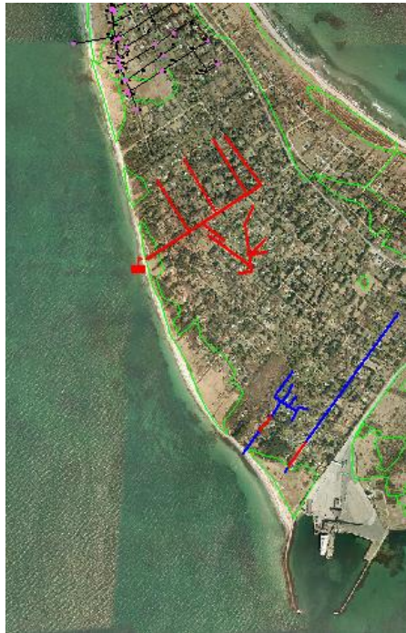
Fig. 3. Oversigtskort over de registrerede udløb i nærheden af badestedet