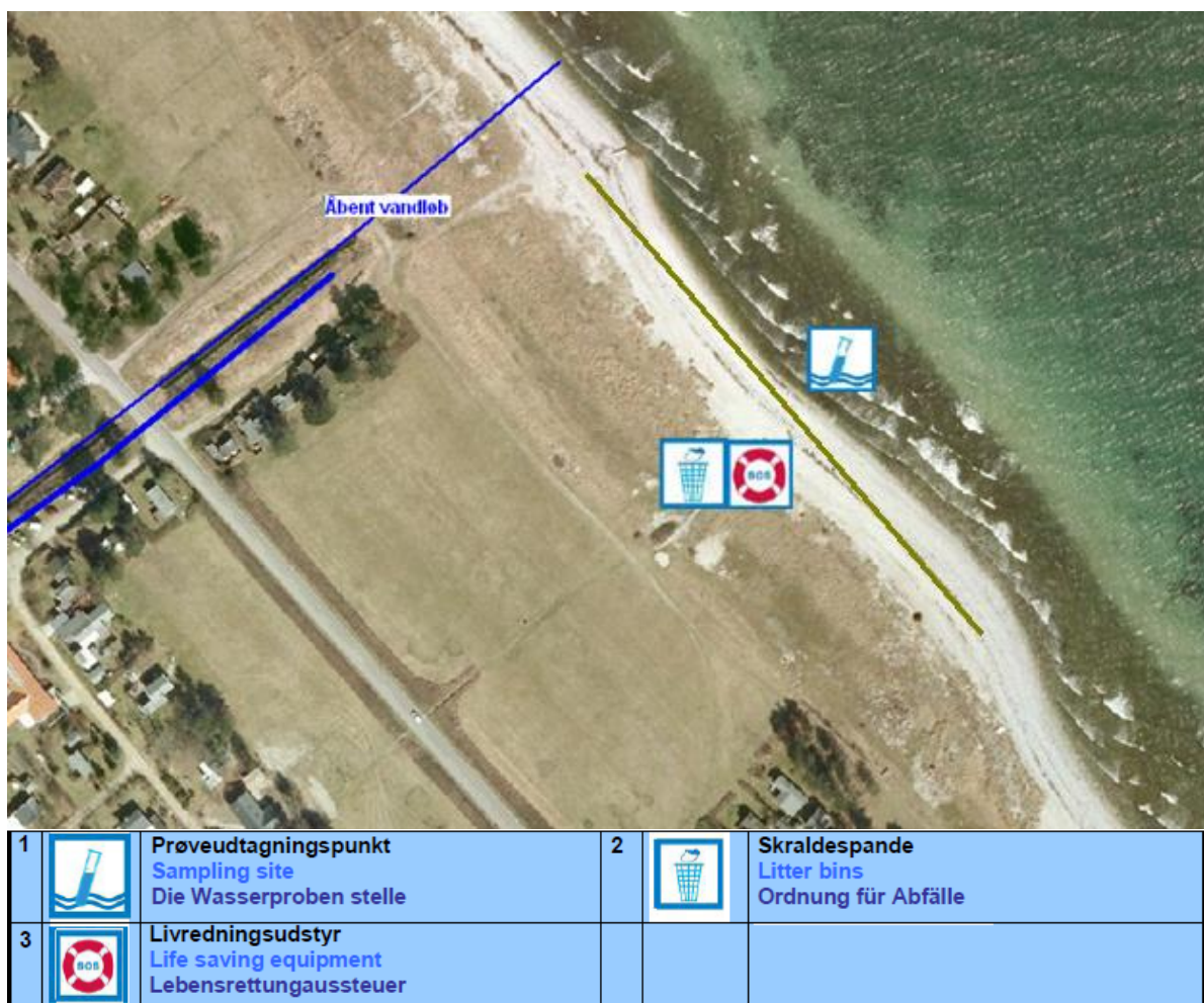
Fig. 1. Oversigtskort over Klintsø kanalstranden, med information om diverse faciliteter.

Badestedet er beliggende ud til Nyrup Bugt, ved Klint. Her findes en stenstrand og strandens udstrækning fremgår af kortet nedenfor (Fig. 1). Stranden er ca. 200 meter lang og består af et område af sten der er ca. 20 meter bredt. Der er, for enden af broen, over 1 meter til bunden og der er 250 meter til 2 meters dybde (aflæst på søkort).