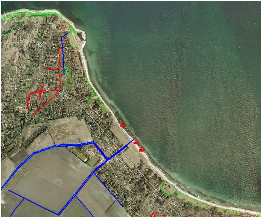
Fig. 3. Oversigtskort over de registrerede udløb i nærheden af badestedet